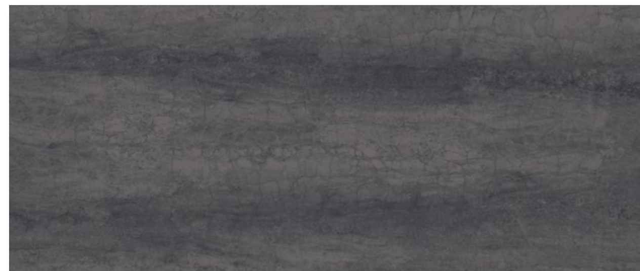
K11 Savoia antracite - Savoia charcoal