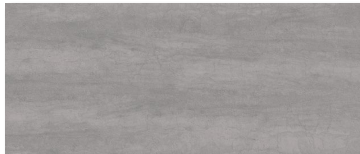
K12 Savoia cemento - Savoia concrete