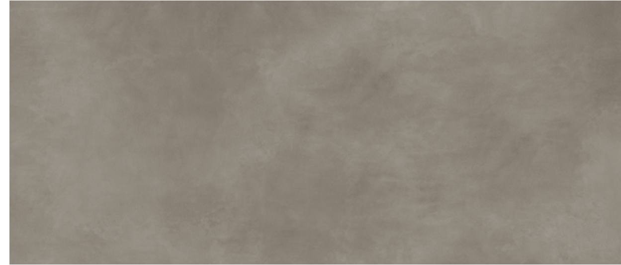
K26 Calce tortora - Lime tortora