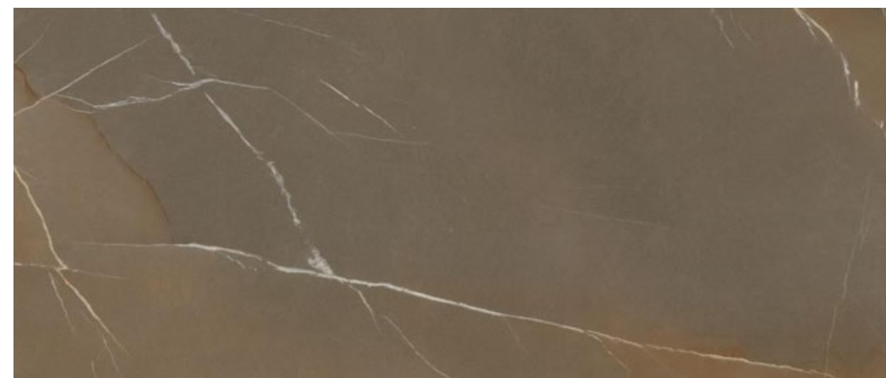
K55 Pietra piacentina taupe materica - Piasentina stone taupe materico