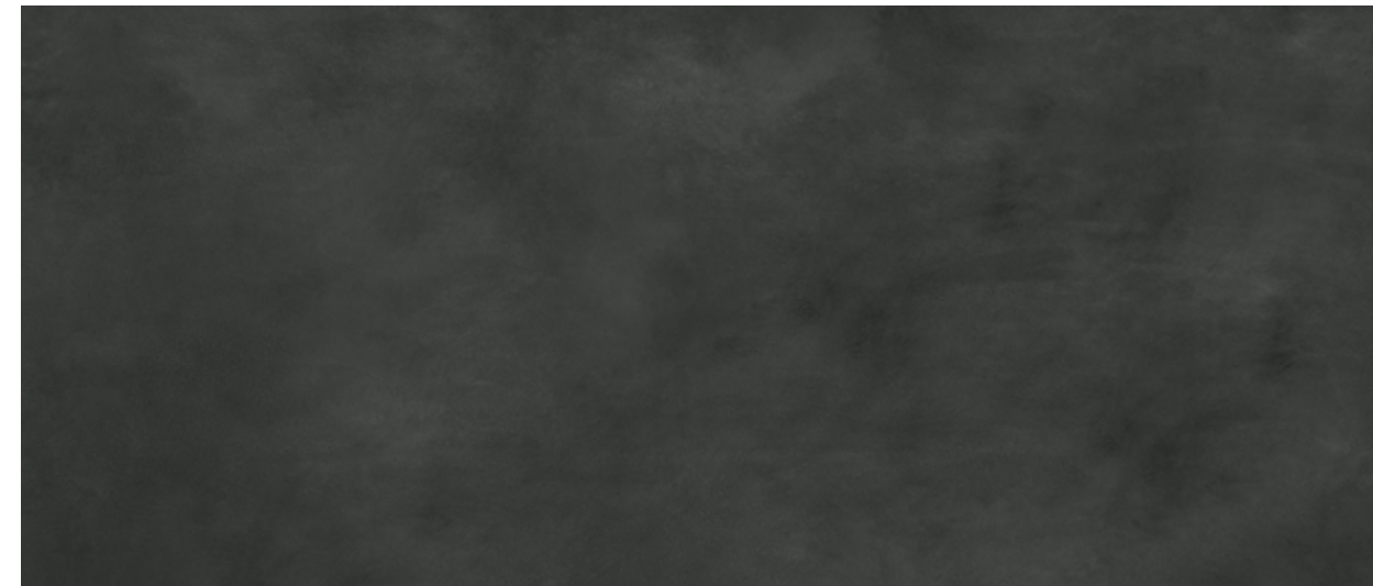
K25 Calce nero - Lime black