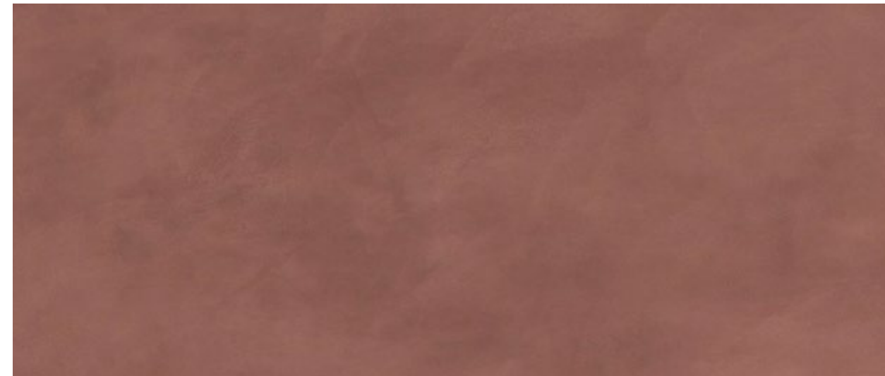
K90 Terracotta opaco - Terracotta matt