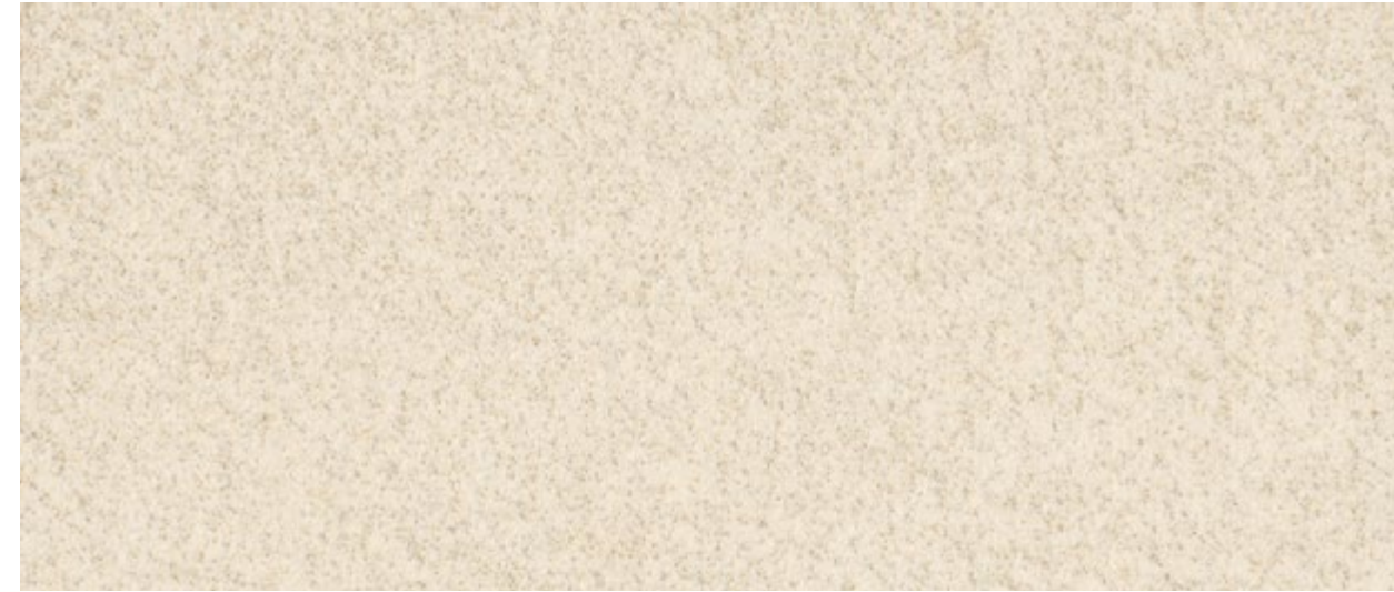
K24 Calce bianco - Lime white