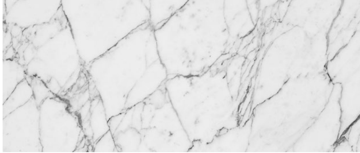
MB4 Bianco Calacatta Vagli - White Calacatta Vagli