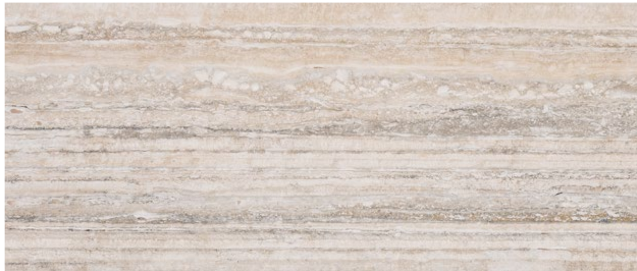
MB2 Beige Travertino Romano